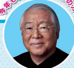
[全国大会審査委員長]