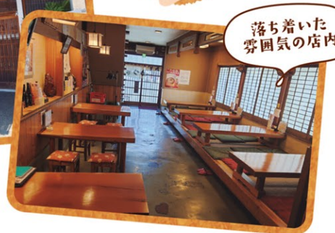
落ち着いた雰囲気の内