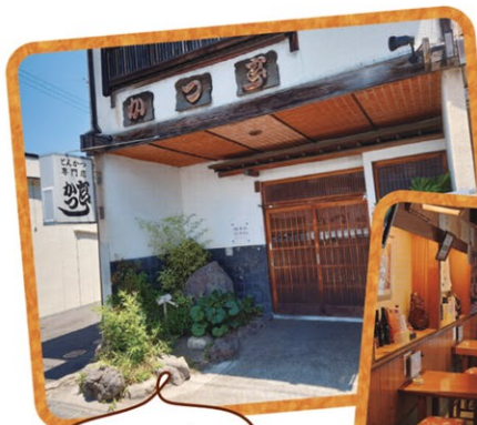
趣がある佇まいの老舗