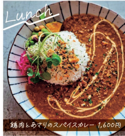
鶏肉とあまりのスパイスカレー 1,600円

ランチタイムでは、カレー、パスタ等に旬の県産野菜を使用したサラダとソフトドリンクがつくので、単品で召し上がるよりお得です。訪問した日は「シェフの気まぐれカレーセット」を注文。鶏肉とあさりは見た目ではわかりませんが、滑らかな舌触りが特徴。実は具材がお客様に均等に行き渡るよう細かくしているようで、お客様への配慮が嬉しいですね！(ランチセットの価格は1,700円～)