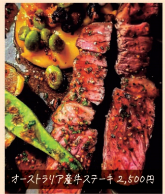
オーストラリア産牛ステーキ 2,500円

HYPEさんで提供されるお料理はどれも芸術作品のようです。また、奥深い味わいで、視覚と味覚が満たされます。食材は季節によって旬のものを使用されているため、四季の変化を感じる楽しみもあります。ご自分へのご褒美に、シェフの思いが込められた一皿をぜひご賞味ください。