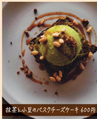
抹茶と小豆のパスクチーズケーキ 600円